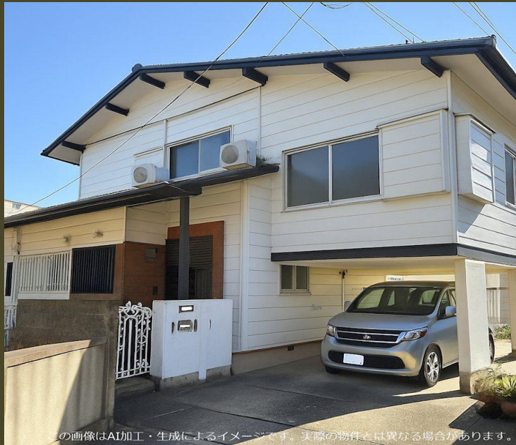
この画像はAI加工・生成によるイメージです。実際の物件とは異なる場合があります。

バス停 E3他：桜町バスターミナル・熊本駅方面「高杉（熊本県）」 徒歩 5分 豊肥本線「武蔵塚」駅 徒歩 15分