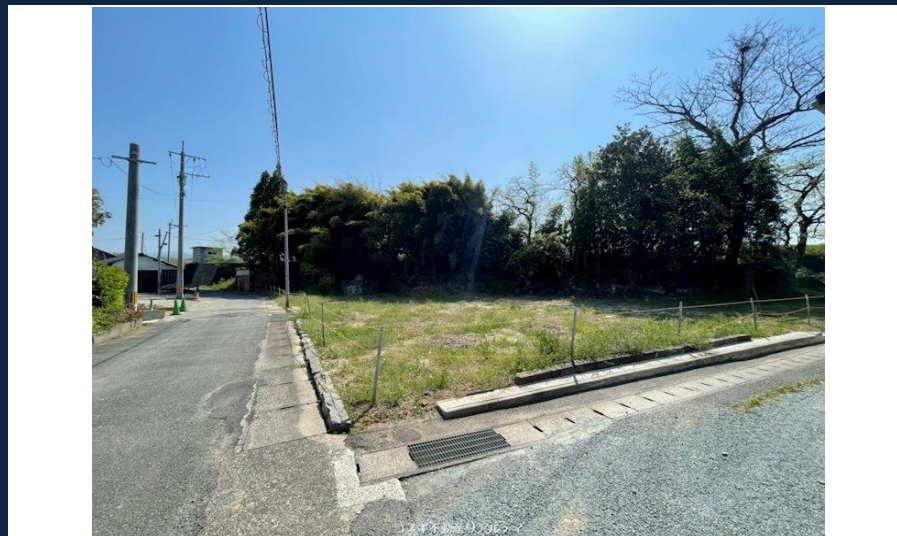
※現況優先となります。

本広告の有効期限は情報更新日より1か月間です。 情報更新日 2022年4月15日