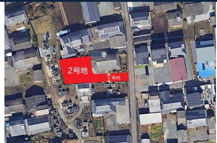
※現況優先となります。