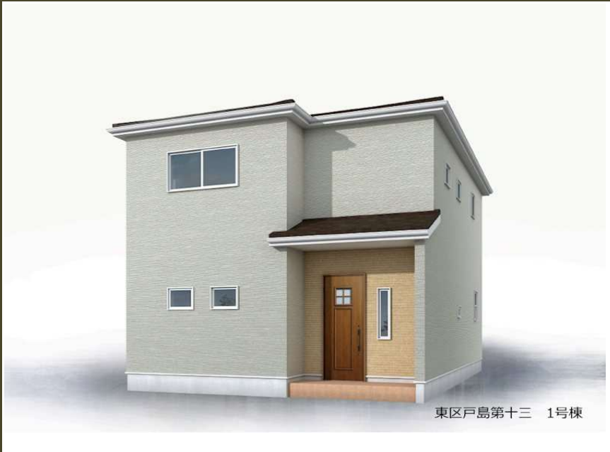
東区戸島第十三 1号棟

周辺環境 ロ-ソ 熊本戸島二丁目店 1,372m / 小山齒科医院 1,457m / 熊本市立託麻東小学校 2,014m / くまもと成仁病院 2,030m / JA熊本市小山戸島支店 2,040m / マックスバリュ新戸島店 2,183m / 小山戸島郵便局 2,356m / 熊本市立二岡中学校 2,405m / ドラッグストア 戸島店 2,587m 交通 バス停 F2・G1・G2・S4：託麻・戸島（八反田経由）「戸島駐車場前」 徒歩 2分