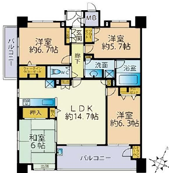
略図につき現況優先と致します

周辺施設 R-1 大江三丁目店 192m / 私立慶誠高校 337m / 大江の森保育園 349m / 熊本市立白川中学校 350m / 熊本市立大江小学校 422m / 熊本市立図書館 470m / グラパレツ熊本 516m / 私立九州学院高校 611m / イオン 熊本中央店 626m / 私立熊本学園大学 846m