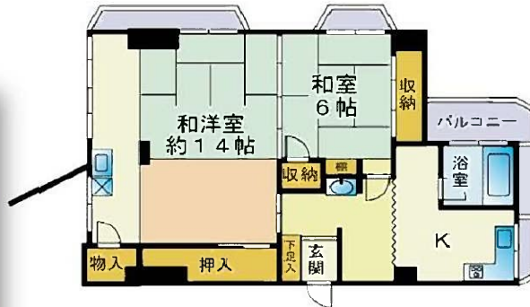
略図につき現況優先と致します