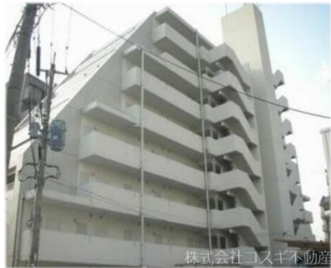
株式会社コスギ不動産

表面利回り16%のオーナーチェンジ物件です。 コンビニ・郵便局・飲食店近く周辺環境充実してます♪